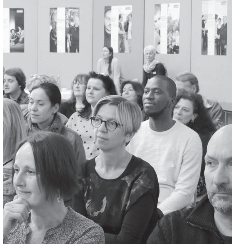
Tagung der Ehrenamtlichen im Jänner 2016

knüpfen und die Beziehungsarbeit „geht leicht“, herausfordernd sei die Deliktverarbeitung. Er fühlt sich jedenfalls akzeptiert; bisher hätten ihn