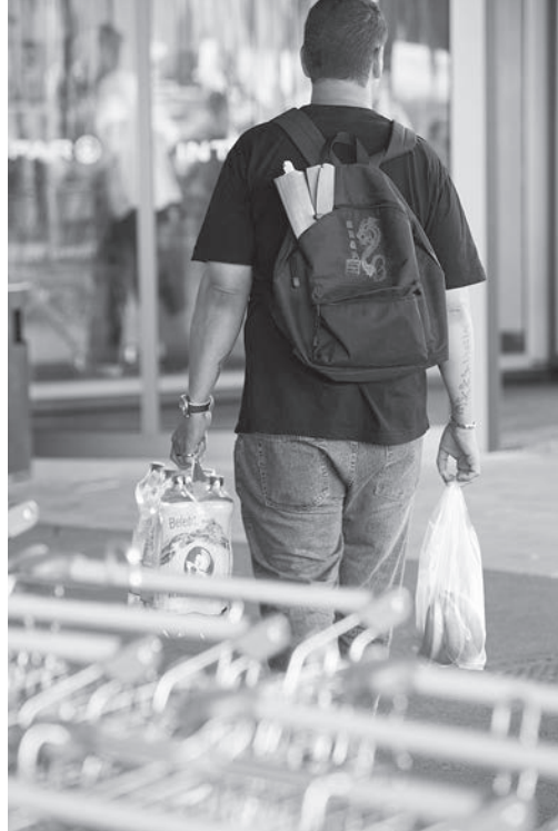
Lebensmittel einkaufen mit Fußfessel – nach genauem Zeitplan

Auch für eine andere Familie war die Fußfessel die Rettung vor der Fremdunterbringung des Kindes. Zwar hätte in diesem Fall der Mann die Haft antreten müssen; das Problem war, dass