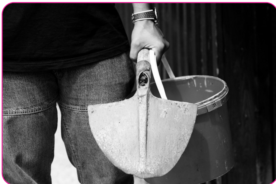
Mehr Arbeit für das Gemeinwohl statt Tatausgleich?

Einer der Kernbereiche des Tatausgleichs waren ja immer die Gewalttaten, inklusive gefährlicher Drohungen und ähnlichem mehr in Naheverhältnissen. Familie, Freundschaft, Schule – in diesem Bereich gibt es die Diversion nach wie vor sehr intensiv. Wir haben aber auch durch zwölf Jahre Diversion erlebt, dass es da Beispiele gibt, wo ein Tatausgleich geradezu zum Scheitern verdammt ist, weil so vielschichtige Interessen vorhanden sind; etwa bei der Trennung eines Ehepaars mit Kindern, wo es um die Vermögenssituation geht, die Unterhaltszahlungen, die Obsorge, das Be-