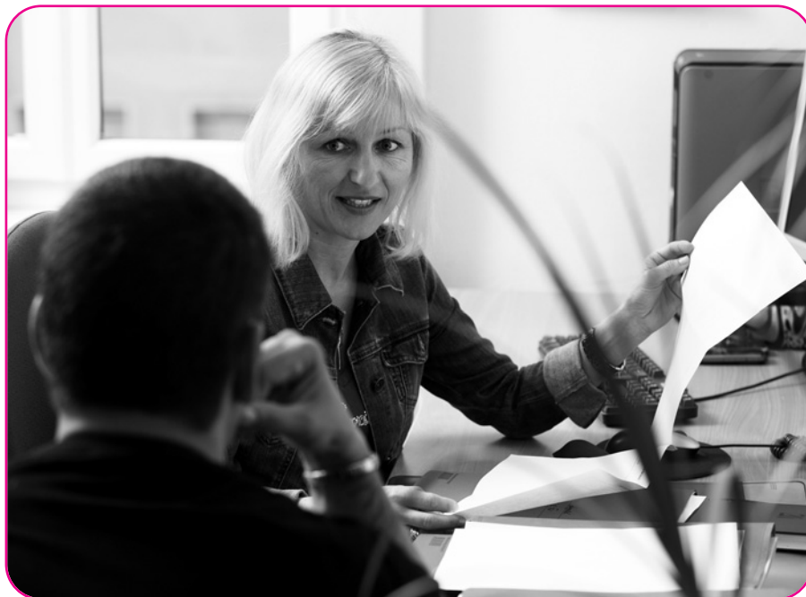
Die Bewährungshelferin vereinbart mit ihrem Klienten die Ziele der Betreuung