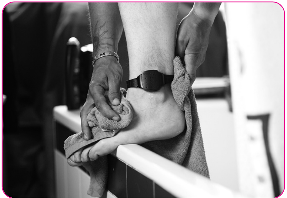
Die Fußfessel ist überall mit dabei

In Österreich gibt es seit Einführung des elektronisch überwachten Hausarrests Mitte September 2010 zwei Schwerpunkte: Freiheitsentzug durch den Aufenthalt in der Wohnung und Intensivbetreuung durch Sozialarbeit mit Elementen eines Arbeits- und Sozialprogramms. Bevor von der zuständi-