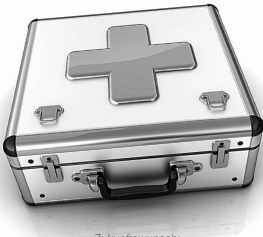
Zukunftswunsch: Erste-Hilfe-Paket für Opfer von Straftaten

Nüchtern betrachtet sei, so Facchin, bei manchen Berufsgruppen die Wahrscheinlichkeit höher, dass man Opfer von Gewalt werde – dass man etwa in einer Trafik oder als Taxifahrer Opfer von Raub wird. Nach solchen Ohnmachtserfahrungen mit gesundheitlichen Beeinträchtigungen gebe es wenig Orientierung und Unterstützung. Und jeder versuche anders, diese Erfahrungen zu bewältigen: Manche versuchten den Alltag rasch wieder einkehren zu lassen, manche zögen sich zurück und wollten keinen Kontakt mit den sozialen Umwelten.