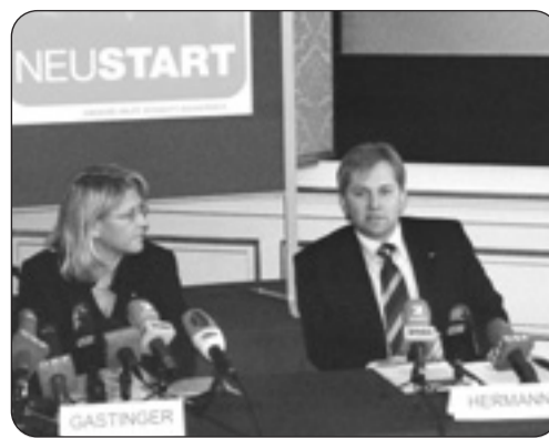
Justizministerin Mag. Karin Gastinger bei der Pressekonferenz am 14. Februar 2006

Was bedeutet es, eingesperrt zu sein? In den Köpfen vieler Menschen hält sich das Bild von fernsehenden, nichts tuenden Insassen, die es sich auf Staatskosten gut gehen lassen. Tatsächlich ist es so, dass Häftlinge oft viel lieber arbeiten würden, um ihr eigenes Geld zu verdienen und