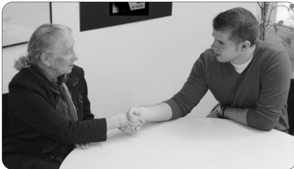
„Was ich getan habe, tut mir leid“ NEUSTART sucht die Versöhnung von Opfer und Täter

Seit mittlerweile 20 Jahren gibt es in Österreich den Außergerichtlichen Tausgleich. Was am 13.3.1985 in Linz mit den ersten Fällen begann, präsentiert sich heute als erfolgreiches Instrument des seinerzeit als Modellversuch im Jugendstrafrecht etablierten Gedankens, dass Konflikte auch anders als nur vor Gericht lösbar sind. Bei Jugendlichen funktionierte das Modell so gut, dass es ab 1991 auch bei Erwachsenen erprobt wurde, ebenfalls mit Erfolg. 8.888 Opfer erhalten jährlich rund zwei Millionen Euro an Schadenswiedergutmachung. In 88,2 Prozent der Fälle gibt es bei Jugendstrafsachen positive Abschlüsse; bei den jungen Erwachsenen sind es 82,4 Prozent und bei Erwachsenen 73,2 Prozent Konfliktregelungen, bei denen man sich in Gesprächen am runden Tisch auf für alle zufrieden stellende Lösungen einigt.