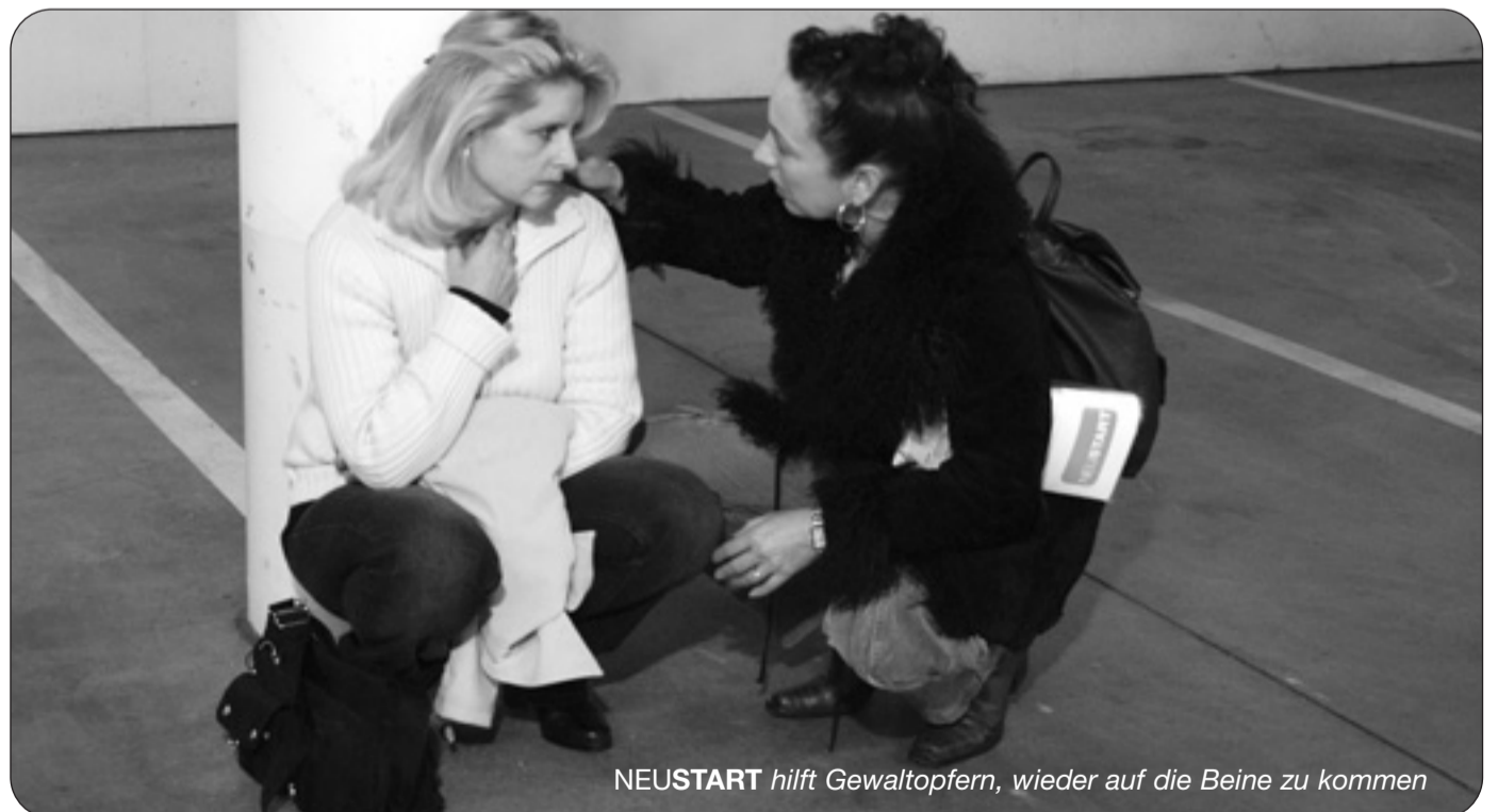
NEUSTART hilft Gewaltopfern, wieder auf die Beine zu kommen

und Prozessbegleitung: 196 Klienten) spezialisiert sind. Im Rahmen des Außergerichtlichen Tatausgleichs erhielten die Opfer rund zwei Millionen Euro an Schadenswiedergutmachung.