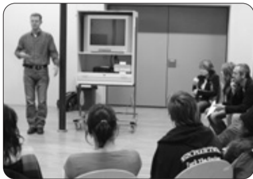
„Wie löse ich Konflikte ohne Gewalt?“ NEUSTART leistet präventive Aufklärung an Schulen

Jedenfalls interessant: neue Projekte wie workflow oder SCHRITT FÜR SCHRITT, die an Lösungen zur Verbesserung der Situation in der Haft und vor und nach der Haftentlassung arbeiten – lesen Sie mehr darüber auf Seite 4.