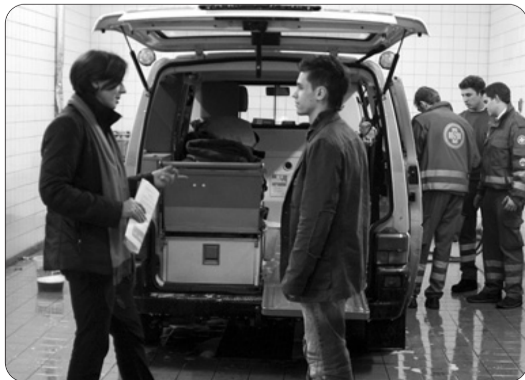
Eine Dummheit kann ohne Vorstrafe bleiben: NEUSTART vermittelt Klienten zur Erbringung gemeinnütziger Leistungen an Partnerinnen wie den Arbeitersamariterbund

3.196 Menschen übernahmen sinnvoll Verantwortung für ihre Taten; statt einer Verurteilung haben Tatverdächtige gemeinnützige Leistungen im Interesse der Gesellschaft verrichtet.