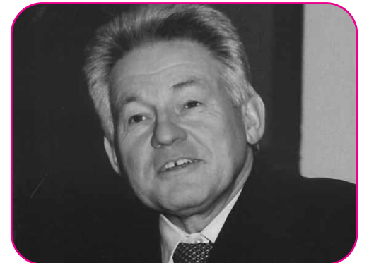
LH Josef Pühringer