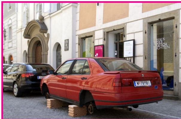
Kunstprojekt: Ed Kowalski Produktion

Auch bei Ed Kowalskis Installation reagierte das Publikum unerwartet. Ein auf vier Ziegelsteinen aufgebocktes Automobil, platziert auf einem öffentlichen Platz, sollte durch diese Irritation die Reaktion auf offensichtliche Gesetzesverstöße deutlich machen. Interessant war, dass einzelne Passanten auf dieses Objekt interessiert, aber auch gegenüber dem Besitzer des Fahrzeugs mit Mitleid reagierten. Nahezu alle langsam vorbeifahrenden Autofahrer reagierten aber irritiert. Die Vermutung des Künstlers, dass das beschädigte Auto weitere Kriminalität (Vandalismus) provozieren würde, bestätigte sich nicht.